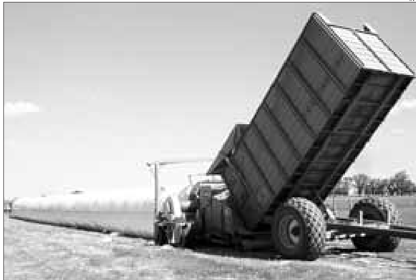
SILOS. GUARDAR FORRAJES PARA LA HACIENDA LIBERA HECTÁREAS PARA HACER AGRICULTURA PROPIA.

"Hacia una ganadería de precisión" es el slogan con el que Pre-